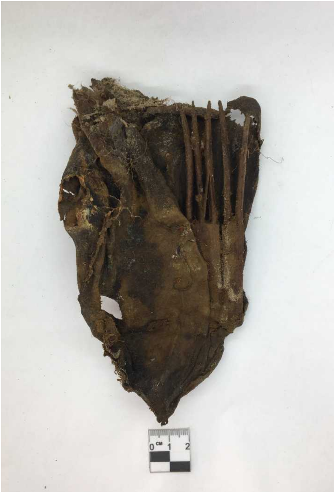
Рис. 1. Терезин, об. № 27. «Верхняя» половина кожаной сумки с деревянным гребнем внутри (до реставрации).