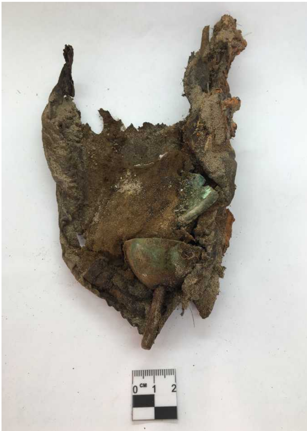
Рис. 2. Терезин, об. № 27.

«Нижняя» половина кожаной сумки с зеркалом в войлочном чехле, костяным пряслицем, веретеном, ножом (шилом?) и кожаной амулетницей внутри (до реставрации).